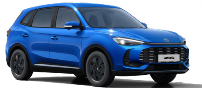
Niebieski Como Blue Lakier metaliczny