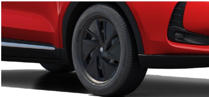
Felgi stalowe 16"