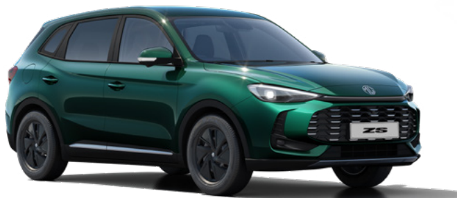
Zielony Emerald Green Lakier metaliczny