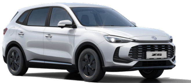
Biały Dover White Lakier standardowy