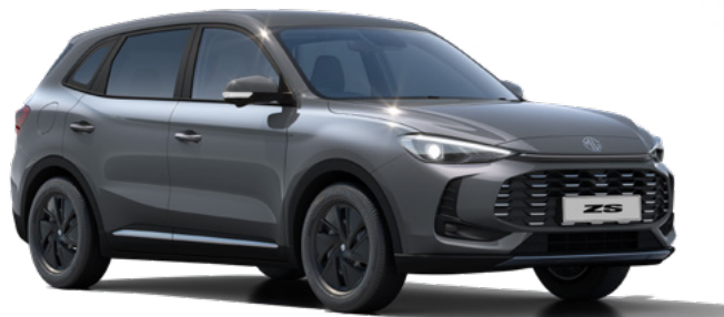
Szary Camden Grey Lakier metaliczny