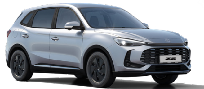
Srebrny Cosmic Silver Lakier metaliczny