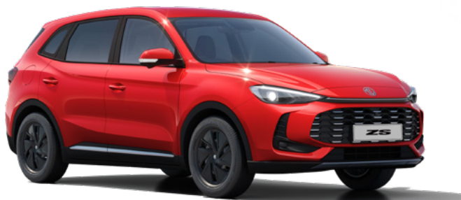
Czerwony Diamond Red Lakier trójwarstwowy