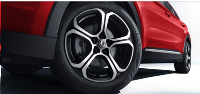
Felgi aluminiowe 17"