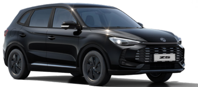
Czarny Pebble Black Lakier metaliczny