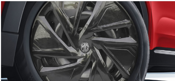
Felgi stalowe 16"