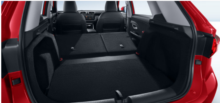
Pojemność bagażnika od podłogi do dachu (fotele w drugim rzędzie złożone) 1457 litry