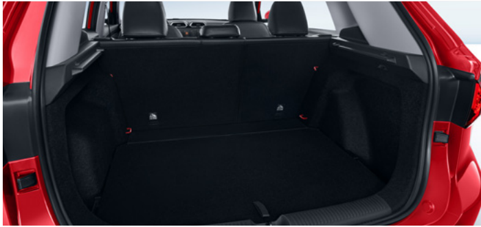
Pojemność bagażnika od podłogi do dachu (fotele w drugim rzędzie w pozycji pionowej) 443 litry