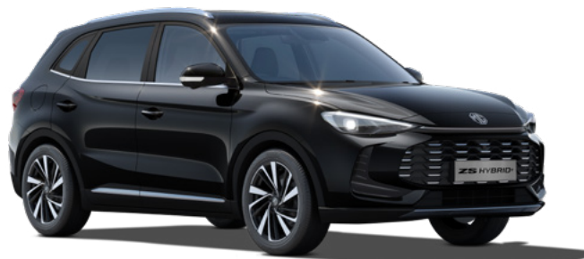
Czarny Pebble Black Lakier metaliczny