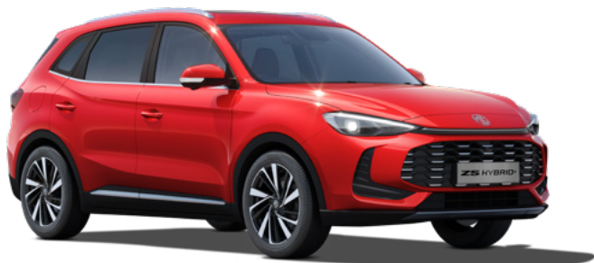
Czerwony Diamond Red Lakier trójwarstwowy