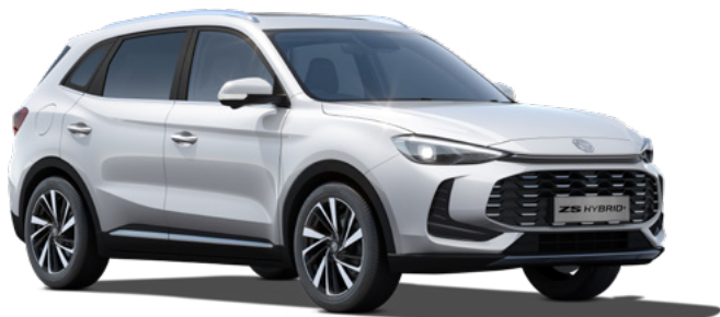
Biały Dover White Lakier standardowy