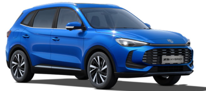
Niebieski Como Blue Lakier metaliczny