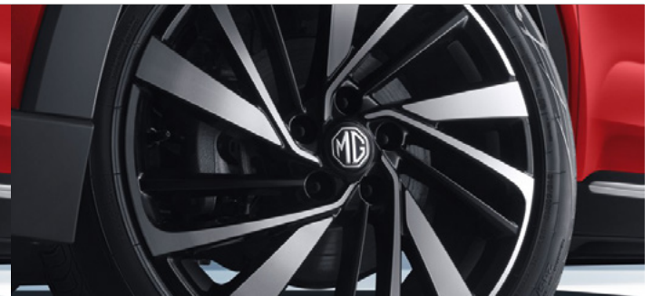
Felgi aluminiowe 18"