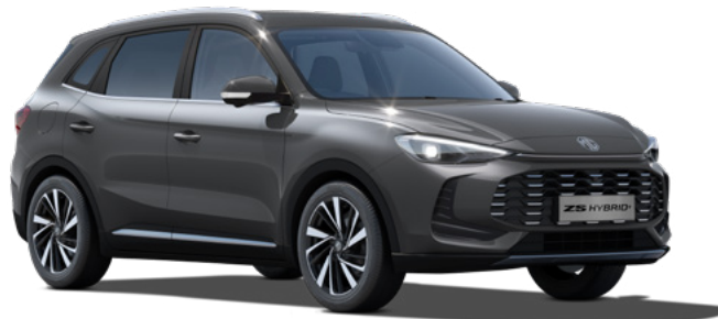
Szary Camden Grey Lakier metaliczny