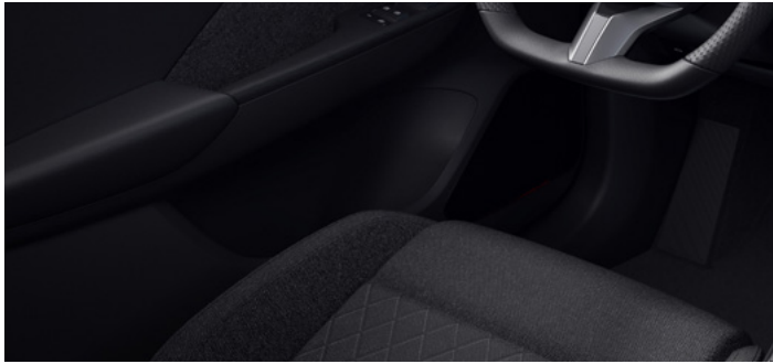
Tapicerka materiałowa czarna