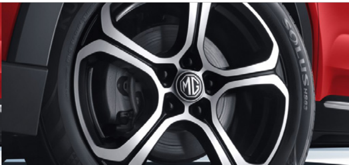
Felgi aluminiowe 17"