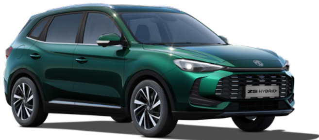
Zielony Emerald Green Lakier metaliczny