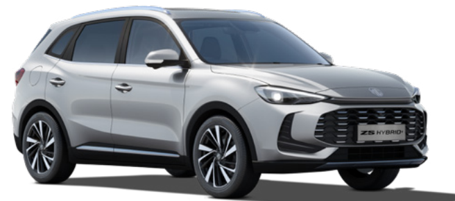
Srebrny Cosmic Silver Lakier metaliczny