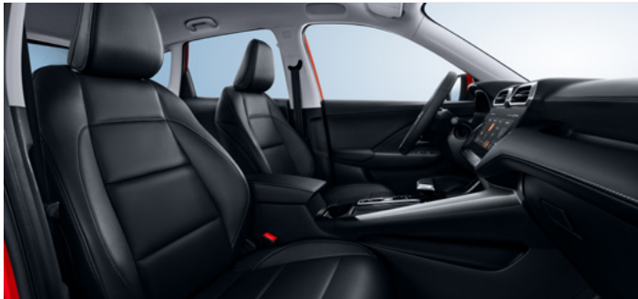
Tapicerka ze skóry syntetycznej