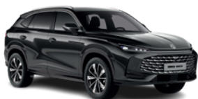
Czarny „Pebble Black” (metalik)