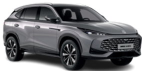
Szary „Hampstead Grey” (metalik)

Wybierz wariant wyposażenia: Excite, Exclusive, i przyciągaj spojrzenia, gdziekolwiek pojedziesz.