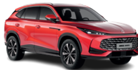
Czerwony „Diamond Red” (trójwarstwowy)