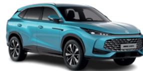
Niebieski „Arctic Blue” (standard)