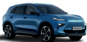
Niebieski „Arctic Blue” (metalik)

W MGS5 EV nie tylko poczujesz się dobrze, lecz także będziesz w nim dobrze wyglądać. Do wyboru sześć wyjątkowych, intrygujących kolorów. Przygotuj się na to, że będziesz przyciągać uwagę.