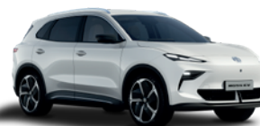
Biały „Dover White” (standard)