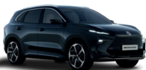
Czarny „Pebble Black” (metalik)