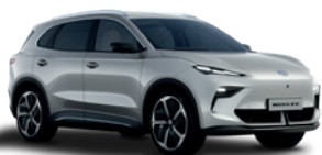
Srebrny „Cosmic Silver” (metalik)