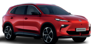
Czerwony „Diamond Red” (trójwarstwowy)

* Lakiery trójwarstwowy i metaliczny dostępne za dodatkową opłatą.