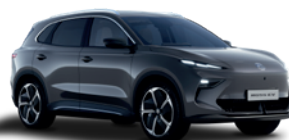
Szary „Hampstead Grey” (metalik)