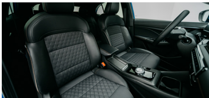
Tapicerka materiałowa z elementami ze sztucznej skóry