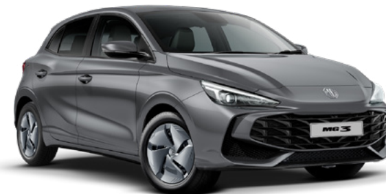
Szary Camden Grey Lakier metaliczny