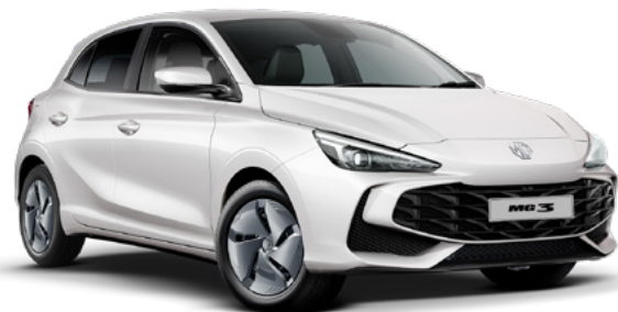
Biały Dover White Lakier standardowy