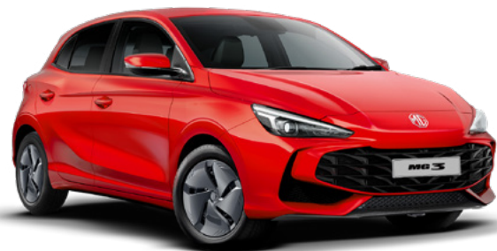
Czerwony Diamond Red Lakier trójwarstwowy