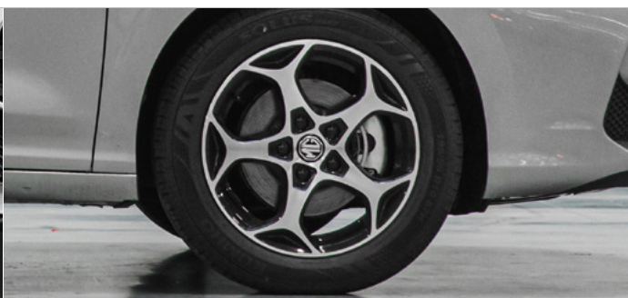
Felgi aluminiowe 16" 195/55 R16