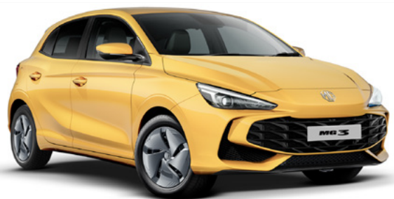
Żółty Pastel Yellow Lakier standardowy