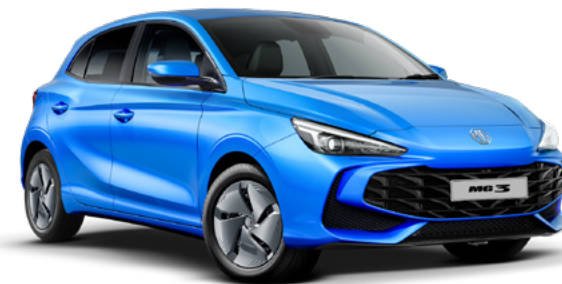
Niebieski Como Blue Lakier metaliczny