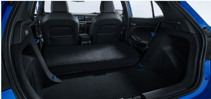
Pojemność bagażnika od podłogi do dachu (fotele w drugim rzędzie złożone) 983 litry