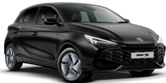
Czarny Pebble Black Lakier metaliczny