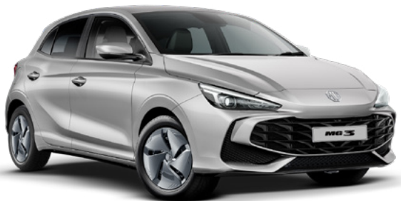
Srebrny Cosmic Silver Lakier metaliczny