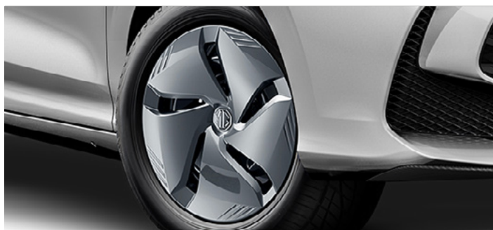
Felgi stalowe 15" 185/65 R15