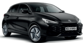
CZARNY „PEBBLE BLACK” (metalik)