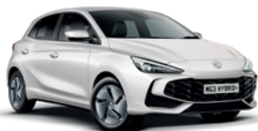
BIAŁY „DOVER WHITE” (standard)