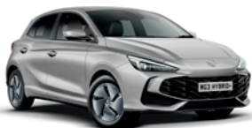
SREBRNY „COSMIC SILVER” (metalik)