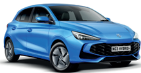
NIEBIESKI „COMO BLUE” (metalik)

MG3 nie tylko sprawi, że poczujesz się dobrze, ale także że będziesz dobrze w nim wyglądać dzięki możliwości wyboru spośród siedmiu wyjątkowych, intrygujących kolorów – z opcjami standardowymi, metalicznymi i trójwarstwowymi. Przygotuj się na to, że będziesz przyciągać uwagę.