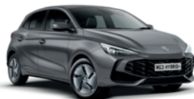
SZARY „CAMDEN GREY” (metalik)