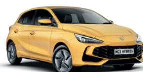
ŻÓŁTY „PASTEL YELLOW” (standard)

* Lakiery trójwarstwowy i metaliczny dostępne za dodatkową opłatą.