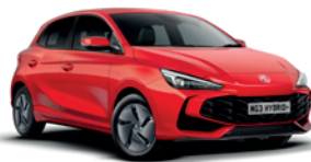
CZERWONY „DIAMOND RED” (trójwarstwowy)