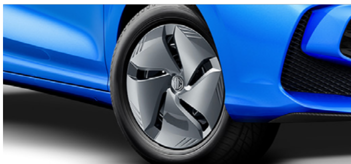
Felgi stalowe 15" 185/65 R15