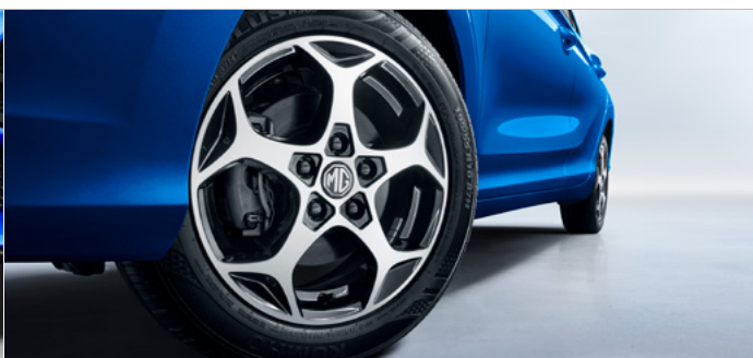
Felgi aluminiowe 16" 195/55 R16