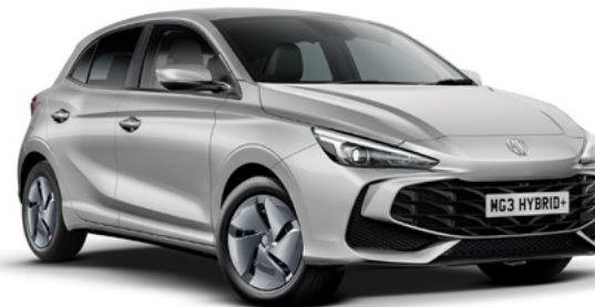
Srebrny Cosmic Silver Lakier metaliczny