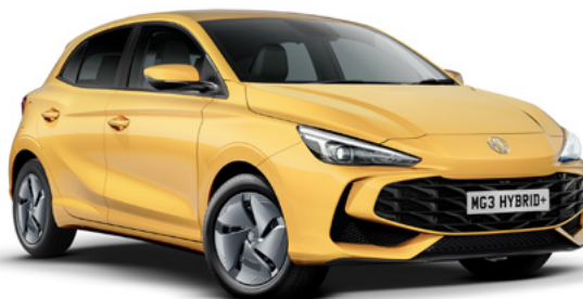
Żółty Pastel Yellow Lakier standardowy