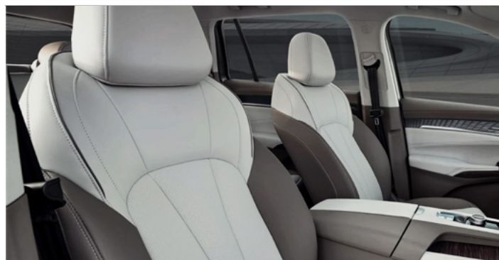
Tapicerka w stylu skórzanym (brązowo-beżowa) (połączenie dwóch odcieni plus dekory drewnopodobne)